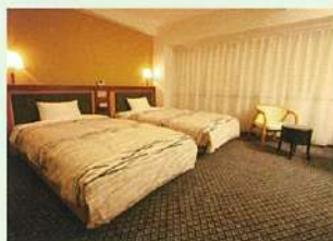
デラックスツイン